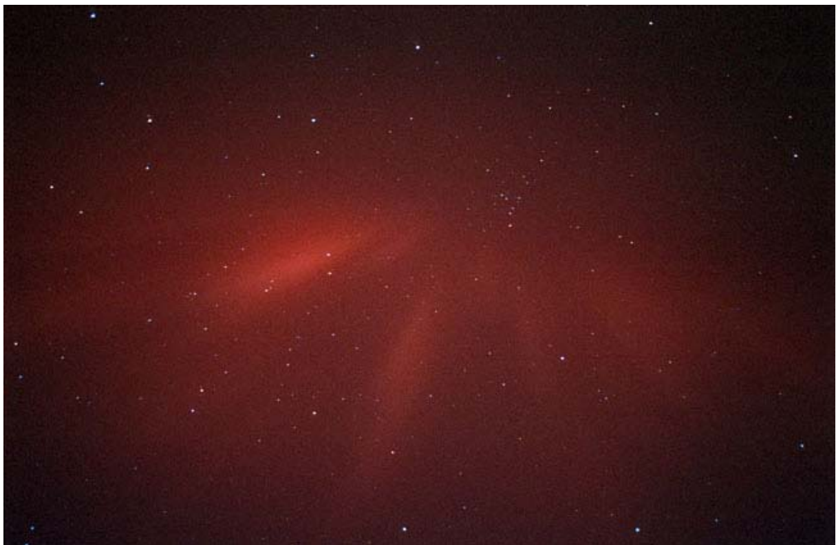
Die Polarlicht-Corona vom 11./12. April 2001. Beobachtet in der Nähe von Venlo. Die Aufnahme wurde mit einem 28/2.8-Objektiv für 60s auf Fuji Sensia 400 belichtet.