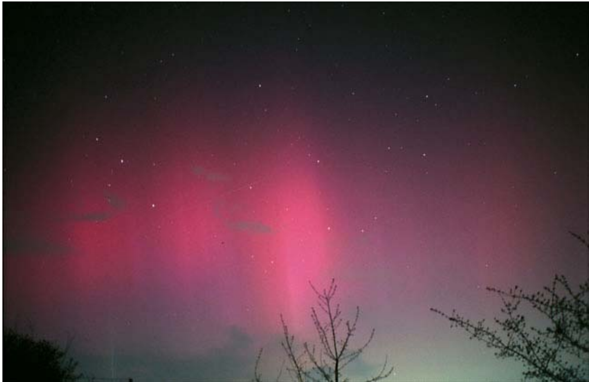
Das Polarlicht vom 31.März/01.April 2001. Beobachtet an der Paul-Baumann-Sternwarte in Klein-Winternheim. Die Aufnahme wurde mit einem 28/2.8-Objektiv für 40s auf Fuji Sensia 400 belichtet.